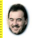
Municipalbes & Batterie