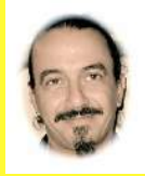
Magie & Basse