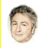
Pêche à la ligne & Saxo

• Betty'z Boob , Garçons Bouchers et Pigalle . • Créateur des Grands Orchestres de l'Elysée Montmartre et de l'Olympia. • Directeur artistique ( La Lune Rousse , Les Trois Baudets, Mère Grand). • Ecrivain (Il était une fois Little Odessa, Du riffifi chez les rockers ). - Réalisateur amateur et pro du vins naturel à 16h02 environ.