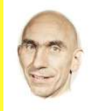
Orgue de barbarie & Chant